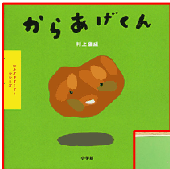
「からあげくん」 村上 康成 作 （小学館）